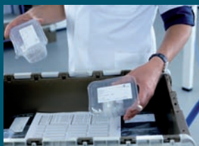
Auf Wunsch regelmäßiger Bortendienst bis vor Ihre Haustür