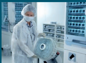
Vollautomatische Produktion unter strenger Kontrolle