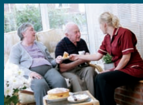
Sicherheit und Einfachheit, die gelassen machen